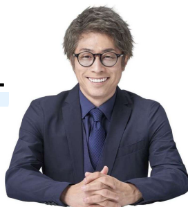
「中小企業から日本を元気にプロジェクト」 公式アンバサダー ロンドンブーツ1号2号 田村淳