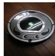
終了時間になると ンパが自動お掃除！